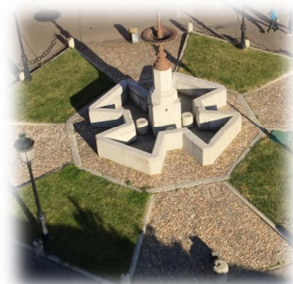
Vista desde la torre de la Fuente Grande, construida en 1867

dicen que el incendio “consumió el chapitel sin haberse reservado cosa alguna de sus materiales, solo puede aprovecharse la Cruz y la bola”. 2 Este incendio del verano de 1721 también causó daños en la sacristía y en la nave de la epístola, la más cercana a la torre.