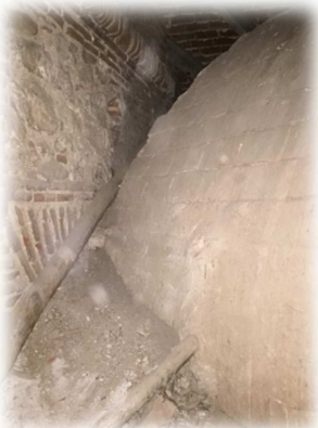
Vista de la estructura de la cúpula